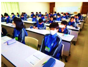
↑ 学習指導 の様子

多くの小学校から生徒が集まっていますが、様々な活動をとおして新しい仲間とうちとけ、これから一緒に頑張っていくための、良い関係づくりができました。