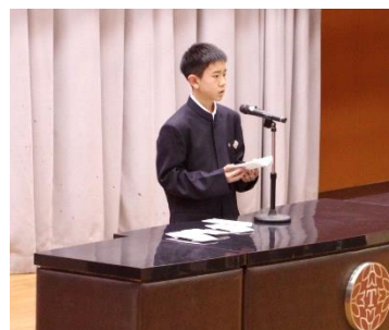
誓いの言葉を述べる新入生代表

春の暖かな日差しの中、入学式を行いました。新入生代表（十日町市立水沢小学校出身）は、「夢の実現に向け、津南中等教育学校で目標を持って幅広く学び、知識を深めていきたい」「自分が歩いた後ろには自分の道ができる。歩という字は少し止まると書く。目標に向かって休まず歩むのもよいが、時にはつまづくこともあると思う。その時は周りの仲間と一緒に考え、少し立ち止まりながらもそれぞれの道を歩んでいきたい」と誓いの言葉を述べました。新入生の出身市町村は、次のとおりです。