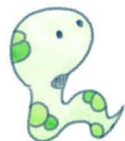
当校キャラクター「大将くん」