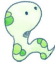
当校キャラクター「大将くん」